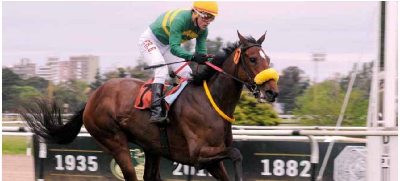
Sweet Mana hizo valer sus buenos arrimes y compensó a sus seguidores con un sport de $6.60