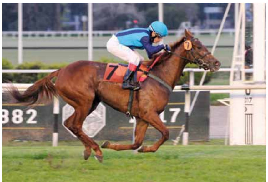
Vida Sana ya ganó dos sobre tres y pinta para cosas serias