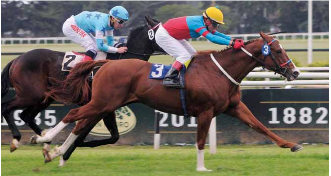
Pure Quality se recuperó de un par de salidas negativas y obtuvo su segundo éxito

por los 400 (evitando tropiezos) y ¡pasó de largo! en los 200 finales, arribando a un claro final de tres cuerpos a favor en 1'10"1/100. Lo divertido del caso es que el dividendo a ganador del candidato de PALERMO ROSA fue de... ¡5,40 por cada uno!: se conoce que, como las carreras eran demasiado temprano (13.15), todavía había poca gente participando de la reunión y que, muchos de ellos... "no iban a cazar".