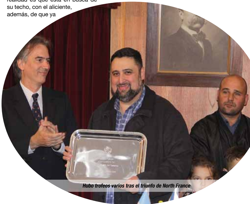
Hubo trofeos varios tras el triunfo de North France

mostró con un triunfo el hecho de que también puede llegar a la milla.