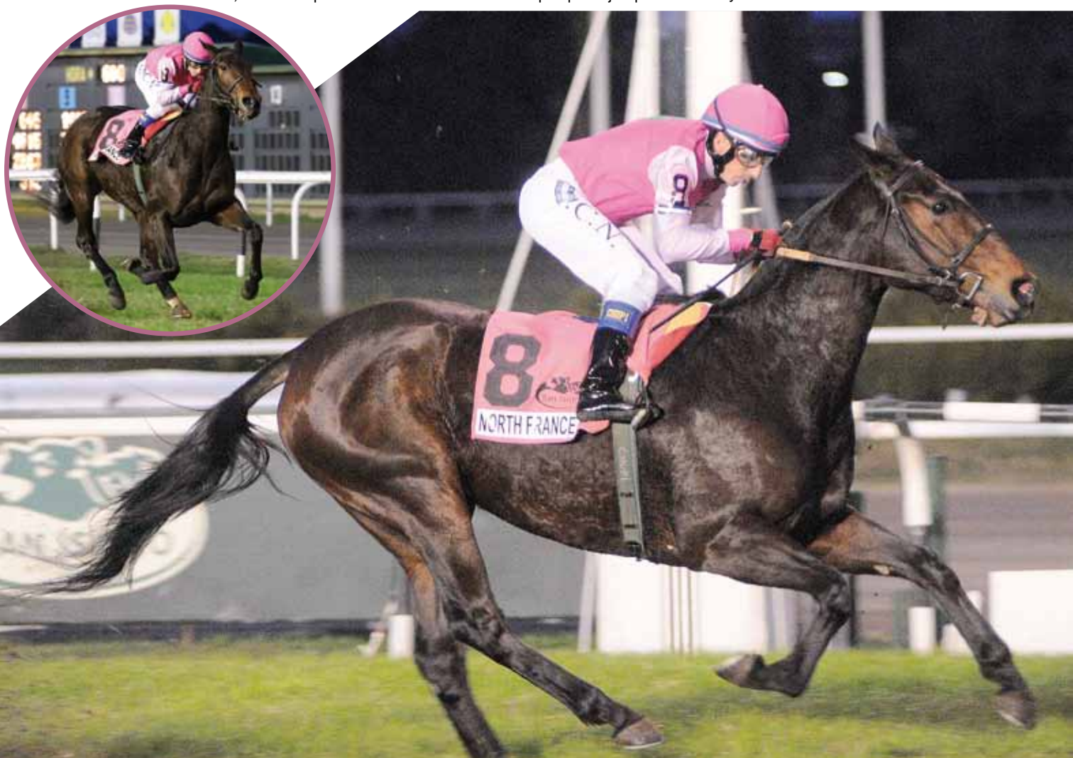
North France ratificó su perfil de ejemplar clásico frente a los del sexo opuesto