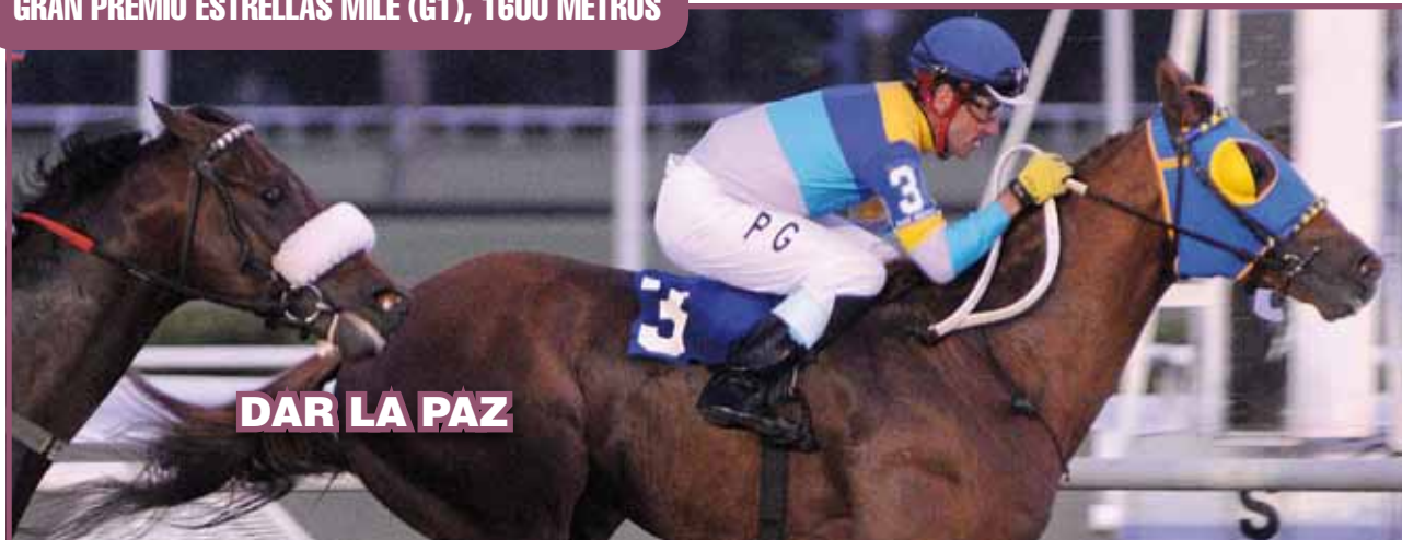
DAR LA PAZ