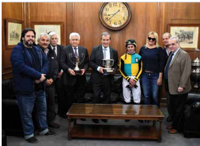
Representantes de Propietarios, en la premiación de Pallars

más corría en el final, y la que le arrebató el puesto de escolta a la yegua de La Esperanza por una cabeza. A medio cuerpo más arribó la favorita Kambara, la cual se la pasó amagando durante toda la recta.